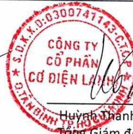
Huyện Thanh Hải Tổng Giám đốc